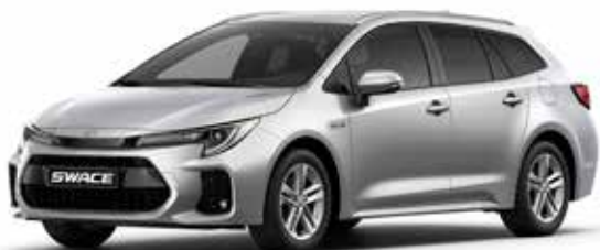
T Silver metallic (1L0)