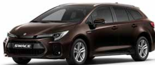
T Phantom Brown metallic (4W9)