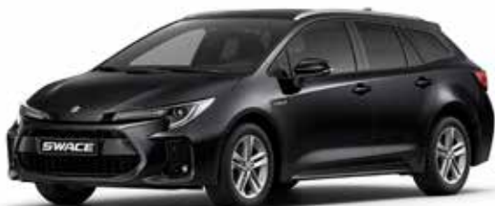
T Black Mica metallic (209)