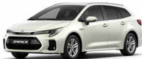
T Platinum White pearl metallic (089)