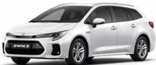
S Super White solid (040)