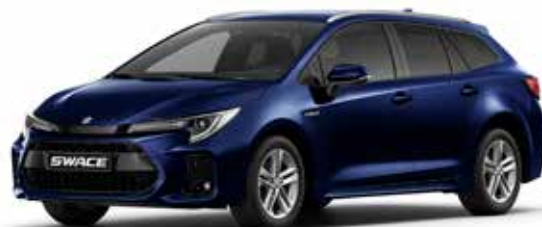
T Dark Blue Mica metallic (8X8)